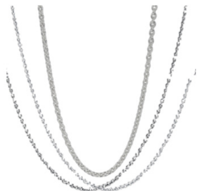
Vyberte si svůj oblíbený ŘETÍZEK

Abychom Vám výběr té správné velikosti usnadnili, vytvořili jsme obrázek, na kterém si můžete představit, jak bude řetízek dlouhý.