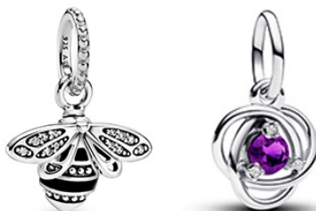
Zkombinujte ho s krásným PŘÍVĚSKEM