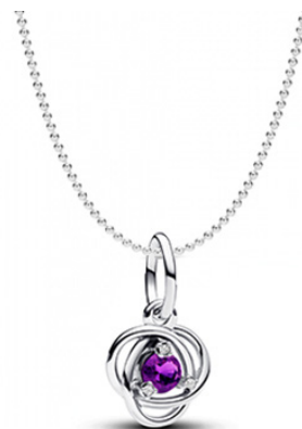
Vytvořte si svůj vlastní NÁHRDELNÍK